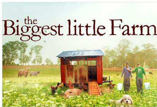
21 november 20 uur filmdocumentaire 'the Biggest little Farm' in Bibliotheek Leusden.

NATUURLIJKE OPLOSSINGEN John en Molly ontdekken gaandeweg dat de natuur voor veel problemen zelf een oplossing biedt. Last van luizen? Door slakken kaalgevreten bomen? Slakken zijn het favoriete hapje van de eend. Binnen de natuurlijke orde heeft elk beestje en plantje zijn eigen zin van bestaansrecht. De natuurlijke orde wordt prachtig in beeld gebracht.