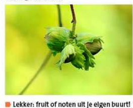
Lekker: fruit of noten uit je elgen buurt!

EETBAAR GROEN, SAMEN DOEN De werkgroep zet in op eetbaar openbaar groen, in de hoop bewoners actief en betrokken te maken bij elkaar en het voedsel in hun directe